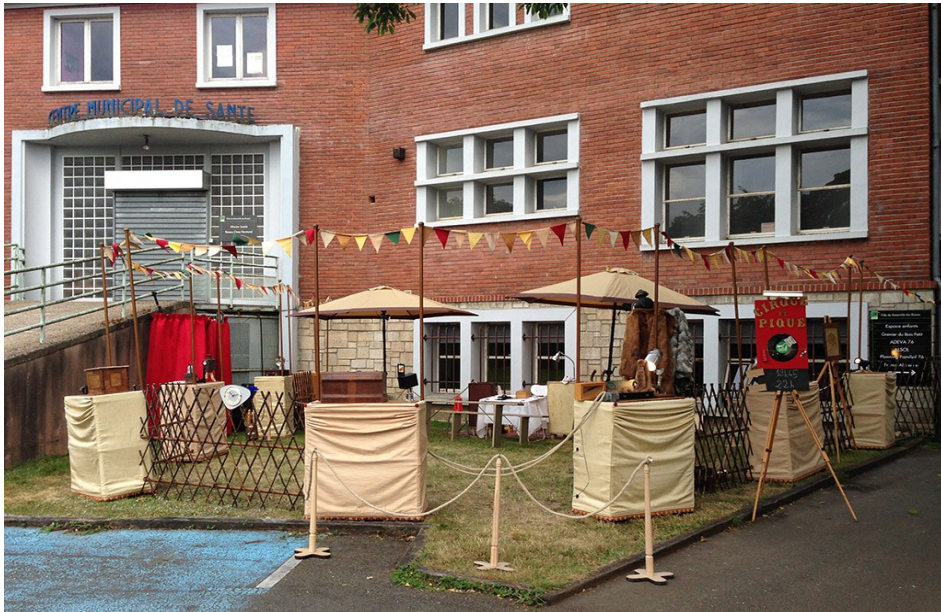
La scénographie est à ciel ouvert, des parasols abritant les spectateurs du soleil.