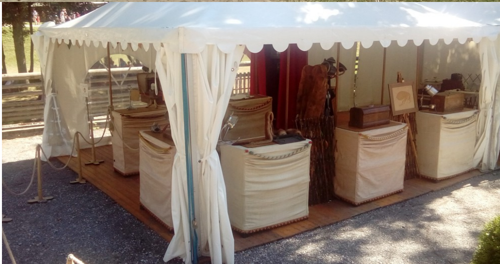
Possibilité de jeu sous tente de réception format 5x10 m, ou sous tente berbère ( Tente fournie et installée par l'organisateur )